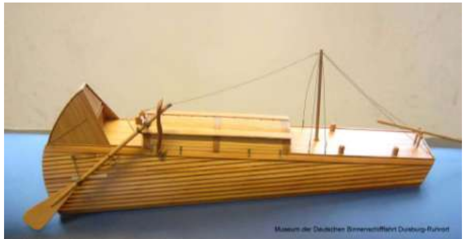
Exacter model Oberländer van Horst Tournay, Ratingen, 1580, tentoongesteld Düsseldorf 2006