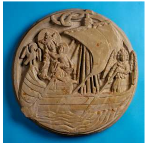
Oberländer op een sluitsteen, St. Kastorkerk te Koblenz, 1499