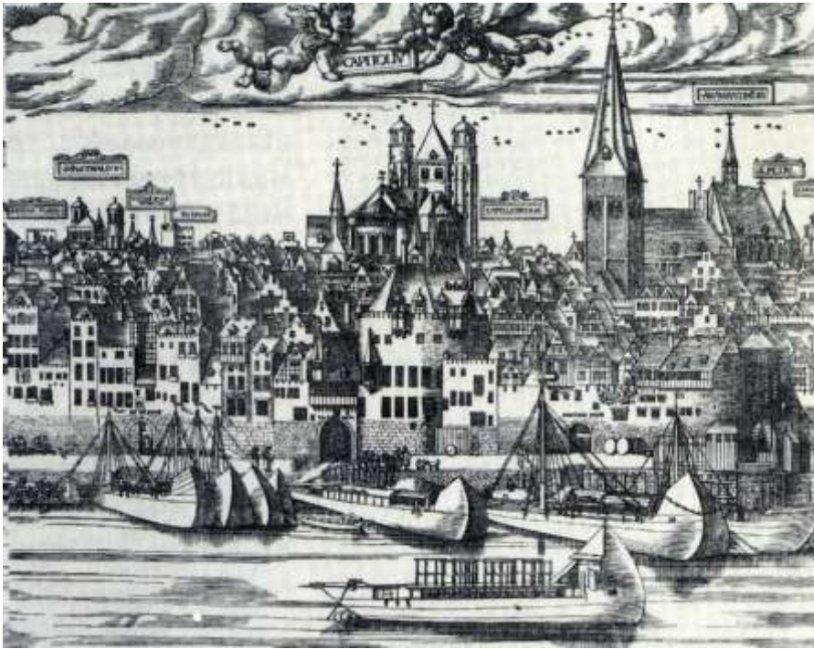
Oberländer bij Keulen, afbeelding Woensam 1557